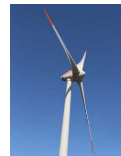
寿都町 風力発電施設